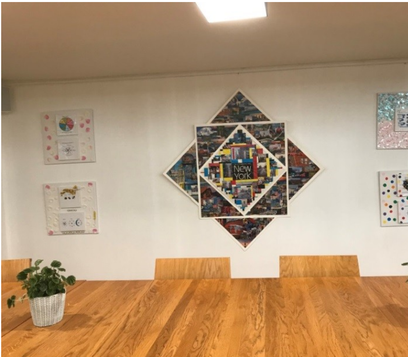
Eén van de kunstwerken.

De ideeën voor haar kunstwerken krijgt Dorine door in stilte te gaan zitten en na te gaan welke symbolen bij de verschillende regio's passen. 'De Verenigde Staten zijn nu nog wereldleider en daarmee de Zeus. Deze masculiene leider staat voor denken vanuit de ratio en competitie, met economie (zorgen voor het inkomen van de familie) als kernwaarde. Daarin is New York de Zeus binnen de Zeus; daar waar de macht en het geld geconcentreerd zijn. Als symbool heb ik het (masculiene, hoekige) vierkant genomen en daarvan een ster gemaakt. Dat staat voor lineair denken.'